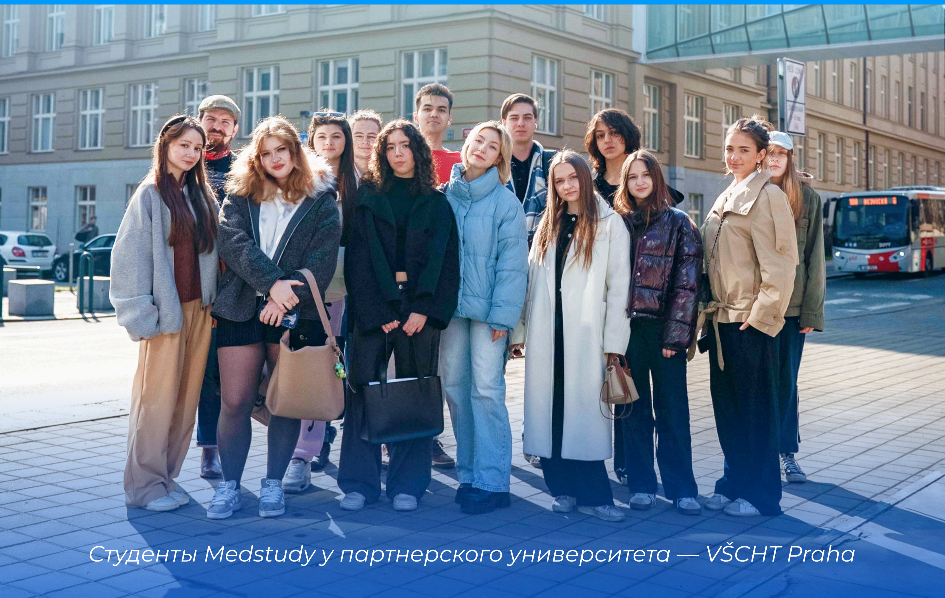
Студенты Medstudy у партнерского университета — VŠCHT Praha

В этом гайде — всё, что нужно знать о поступлении в чешские университеты: от первых шагов до зачисления. Реальные факты, актуальные программы и советы от команды, которая уже подготовила более 800 студентов к поступлению в ТОПовые ВУЗы Чехии.